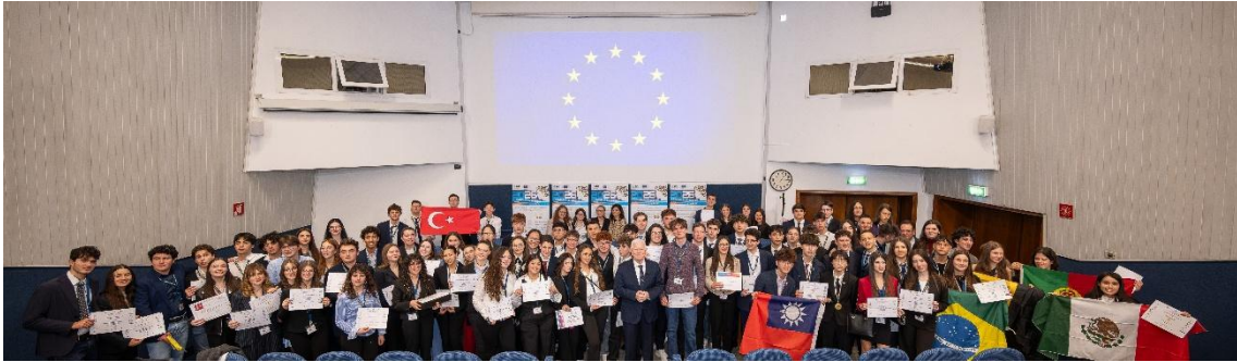
Finalisti 2026 - 38° edizione, Centro Congressi FAST, 23 marzo 2026