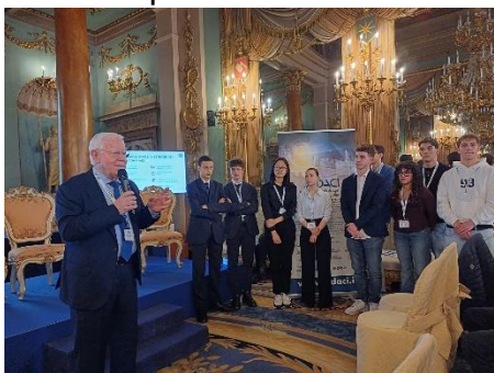
Nella splendida cornice di Palazzo Borghese, a Firenze, nel corso di Medicea Education, il segretario generale FAST presenta il concorso I giovani e le scienze. I giovani scienziati tornano a casa con il premio Medicea Innovator, la menzione Eccellenza Matematica e Fisica e la menzione Progetto Green Management

Nell'ambito dell'attività per la promozione del sapere tecnico-scientifico, la Fast ha una specifica e ampiamente riconosciuta esperienza nella divulgazione verso gli studenti, in special modo quelli delle scuole secondarie di secondo grado. Infatti, negli ultimi decenni, molti dei progetti più importanti della Federazione hanno avuto come destinatari i giovani da una parte, ma anche i loro insegnanti e le famiglie dall'altra, quali componenti fondamentali del loro percorso educativo e veicolo ideale per trasmettere alle ragazze ed ai ragazzi i messaggi chiave per il loro futuro. Non solo; certamente le azioni avviate dalla Fast costituiscono anche un'integrazione ai programmi curriculari ed un arricchimento culturale e personale dei destinatari.